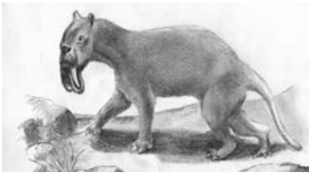
Tigre Diente de Sable